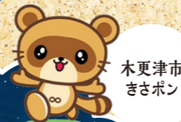
木更津市 きさポン