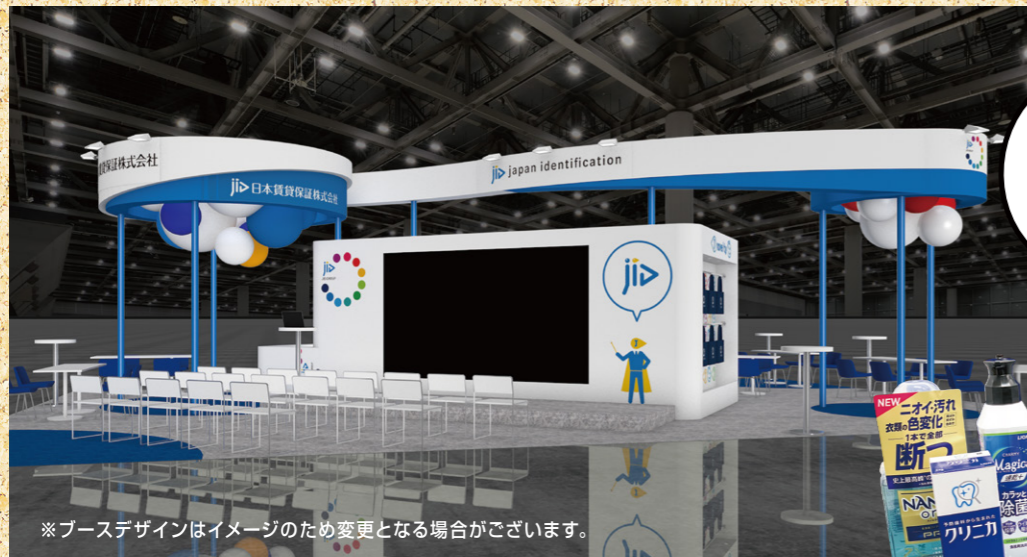
※ブースデザインはイメージのため変更となる場合がございます。

8/6 (Tue) ・ 7 (Wed) 10:00~17:00 東京ビッグサイト(西1・2ホール)