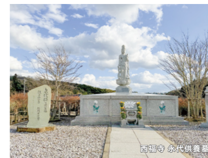
西福寺 永代供養墓

◆お部屋にペットが残されていたり… 明け渡し後、もう飼えないペットがお部屋に取り残されることも。JIDではペットを一時保護しています。衰弱している場合には木更津のNPO法人に協力を仰ぎ、回復するまでお世話をし、その後は里親探しまで行っています。