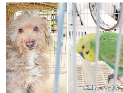
保護したペットたち

◆お部屋にペットが残されていたり… 明け渡し後、もう飼えないペットがお部屋に取り残されることも。JIDではペットを一時保護しています。衰弱している場合には木更津のNPO法人に協力を仰ぎ、回復するまでお世話をし、その後は里親探しまで行っています。